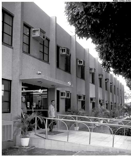
O prazo para entrega dos balancetes referentes ao mês de fevereiro se expirou em 31 de março

Ressalvam porém os comunicados que fica autorizada "a realização de transferências bancárias que preservem o pagamento da folha de pessoal, a partir da remessa dos dados necessários à instituição bancária responsável".