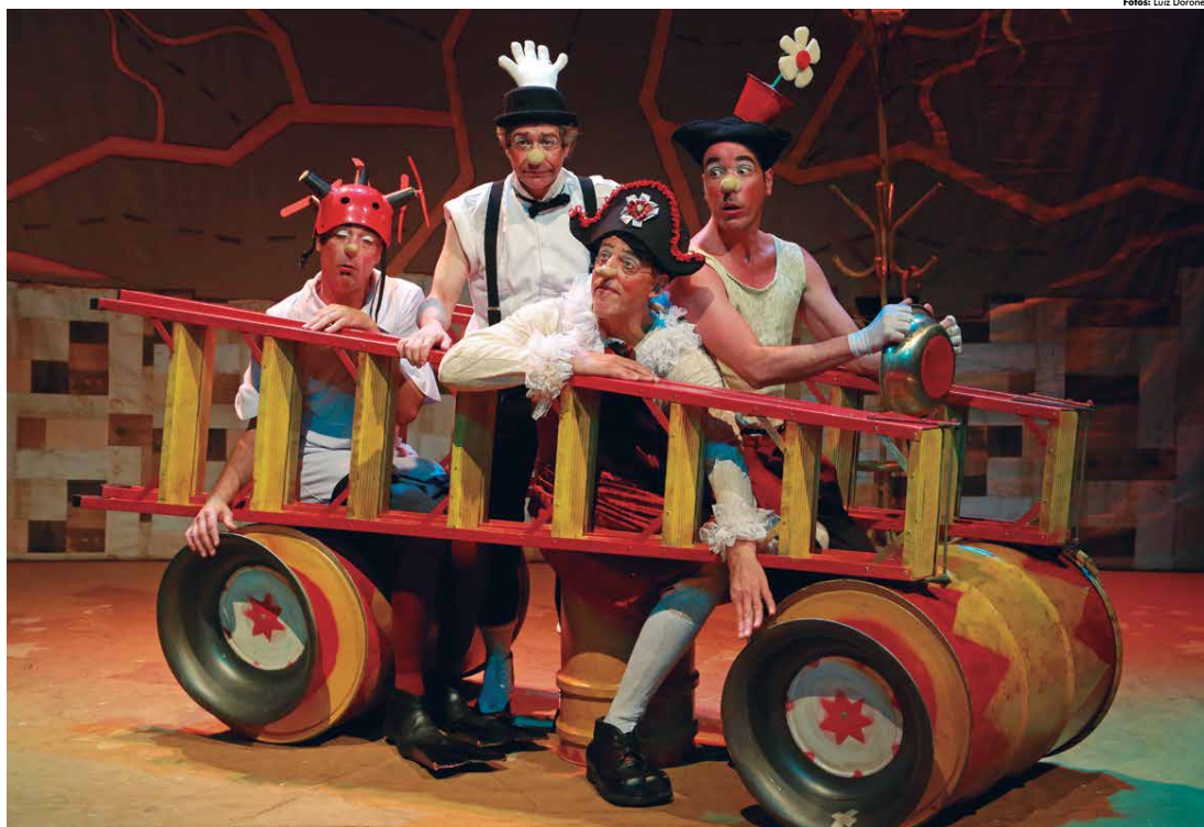
Cena do espetáculo "Os mequetrefes", inspirado na obra do escritor inglês Edward Lear tem um enredo que retrata um longo e divertido dia de quatro palhaços que não por acaso, se chamam Dias e fazem muitas paripóças