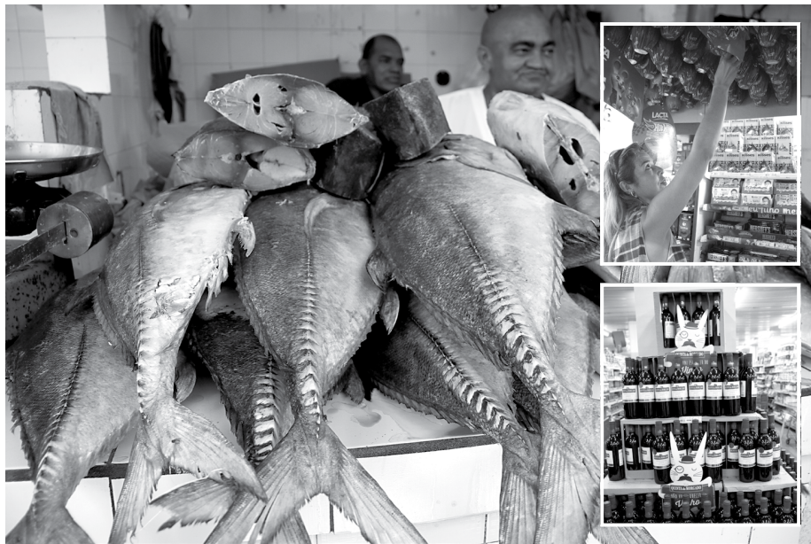
Venda de peixes a corvina foi o item que teve maior variação de preço, a 116,67%. Entre os ovos de chocolate, a maior diferença ficou com o ovo de Páscoa Disney Princesa da Nestlé

Crescimento nas vendas Para os vendedores de peixes, esta é a melhor época do ano para o setor de pescados e a expectativa dos comerciantes é de um cresci-