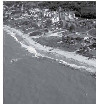
A Costa do Conde é considerada uma das mais belas do Brasil