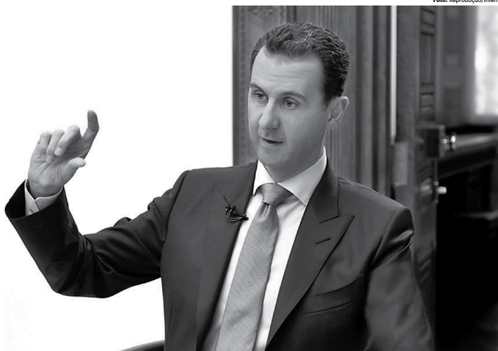
Dictador sírio Bashar al-Assad está sendo responsabilizado pelo ataque com gás sarin, que matou mais de 80 pessoas e deixou dezenas de feridos

Segundo o funcionário, Moscou está tentando sistematicamente encobrir a culpa do regime sírio por atribuí-la ao grupo Estado Islâmico. A fonte acrescentou que a inteligência dos Estados Unidos não acredita que o EI possua gás sarin.